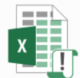
Lignes Directrices de Gestion.xlsx

Il pourra vous adresser un fichier Excel comprenant une feuille « LDG » qui sera déjà alimentée par les données du Bilan Social 2019 de votre collectivité.