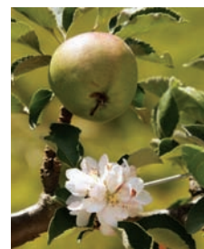
Une ch'tite pomme !