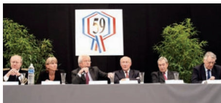
Alain Marleix, secrétaire d'État à l'Intérieur et aux collectivités territoriales (au micro).

Plus de 40 exposants étaient présents sur l'espace réservé aux partenaires : services publics, associations, établissements publics... Un grand nombre d'interlocuteurs aura permis aux élus, expérimentés ou nouvellement installés, d'enrichir leurs connaissances.