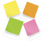
Posts-it de 4 couleurs différentes