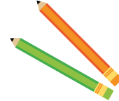
Crayons / feutres